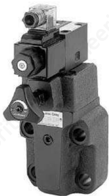
閥類型符號 SYMBOL BSG-※